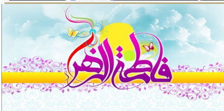
ميلاد حضرت فاطمه الزهرا (س) و روز زن مبارک باد