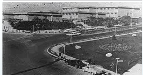
نمایی از میدان مرکزی دانشگاه شهید بهشتی در دهه ۱۳۴۰